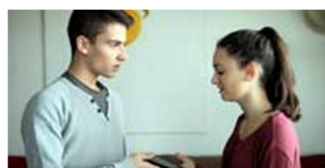
CAPITULO 5. CONTRASEÑA