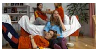
CAPITULO 1. FUTBOL

La serie de cinco cortometrajes “Encuentra el Verdadero Amor”, dirigidos y producidos por la Asociación de Mujeres Cineastas y de Medios Audiovisuales (CIMA) permite trabajar diferentes ámbitos relacionados con la violencia de género en la adolescencia a través de cinco historias diferenciadas protagonizadas por jóvenes. Su visionado debe ser acompañado de las actividades para el uso educativo de los mismos contenidas en la Guía Didáctica, lo que les convierten en un recurso de fácil acceso y utilización para profundizar y trabajar en la prevención de la violencia de género en el ámbito educativo. El objetivo fundamental es enseñar a detectar las primeras señales del maltrato en la adolescencia e informar de qué hacer ante una situación de maltrato.