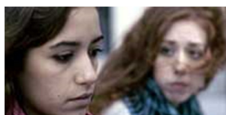
CAPITULO 4. BANCO