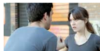
CAPÍTULO 3. TELEFONILL