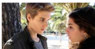
CAPITULO 2. ÁRBOL